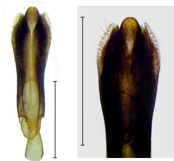
Fig. 2. Edeago y ampliación del ápice del edeago de un individuo de Agrilus viridis de Granada. Escalas gráficas: 1 mm.

Si bien los ejemplares granadinos muestran un edeago algo más ancho que los individuos considerados normales (Fig. 2), la especie es bastante variable tanto en la morfología externa como genital, como ya indicaron Schaefer ( op.cit. ) y Cobos ( op. cit. )