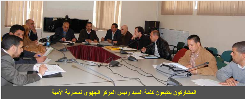
المشاركون يتتبعون كلمة السيد رئيس المركز الجهوي لمحاربة الأمية

افتتح السيد رئيس المركز الجهوي لمحاربة الأمية اللقاء بكلمة استعرض فيها السياق العام للقاء، والأهداف المتوخاة منه وآليات الاشتغال المرتبطة بتنفيذ عملية "من الطفل إلى الطفل"، منوها في ذات الوقت بالمجهودات المبذولة من طرف الجميع خلال السنة الفارطة والتي أفرزت نتائج مشجعة أسهمت في استقطاب العديد من الأطفال المستهدفين من العملية.